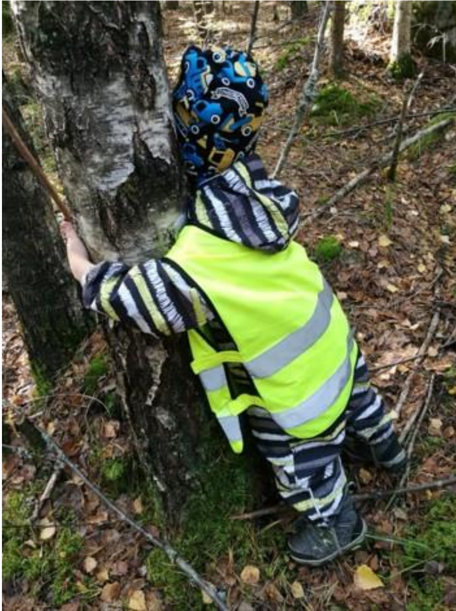
"Metsä hoivaa ja rauhoittaa"

Luonnossa toimimisen tueksi varhaiskasvatukselle laaditaan oma ympäristökasvatussuunnitelma vuoden 2022 aikana. Suunnitelmassa muun muassa esitellään lähiseudun retkikohteita, materiaalivinkkejä sekä vuosikello, jonka avulla voimme toiminnassa huomioida erilaisia teemapäiviä sekä –viikkoja. Suunnitelmassa huomioimme ympäristökasvatuksen ulottuvuudet; oppimisen ympäristöstä ja ympäristössä sekä toimimisen ympäristön puolesta.