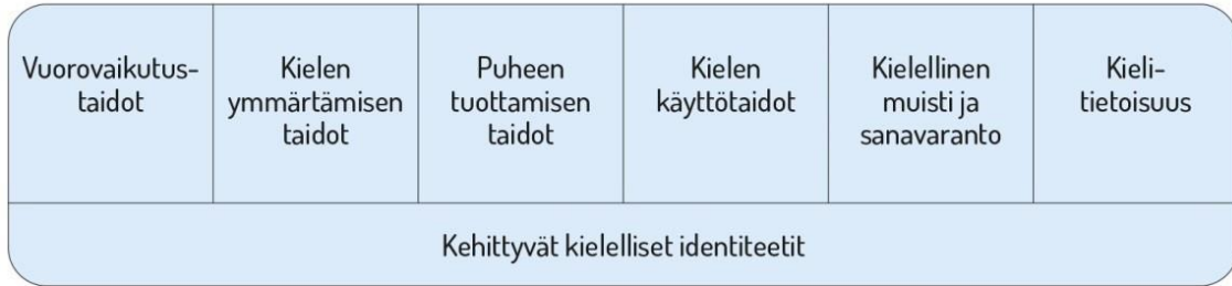
Kuvio 1. Lasten kielen kehityksen keskeiset osa-alueet esiopetuksessa.

Kielen oppimisen kannalta on tärkeää tiedostaa, että saman ikäiset lapset voivat olla eri vaiheissa kielen kehityksen eri osa-alueilla. Lasten kielelliset identiteetit (kuvio 1) kehittyvät, kun heitä ohjataan ja tuetaan kielellisten taitojen ja valmiuksien keskeisillä osa-alueilla.