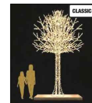
Daniel 440 + asennusalausta 440cm, 143kg lämmin valkoinen led jalusta n. 200x200cm