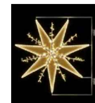
Ingrid 120, 36783.22G 120x115cm, 7,5kg lämmin valkoinen led

Nämä huomioidaan mikäli kausivalaistus saadaan itsenäiseksi, muuten valaistus toimii katuvalojen yhteydessä joulukuun alusta talvilomaviikon loppuun. Puun pos. 3001 valaistus toimii ajastetusti kuten edellä.